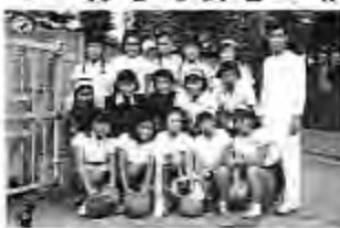
室伏先生と女子バレー部