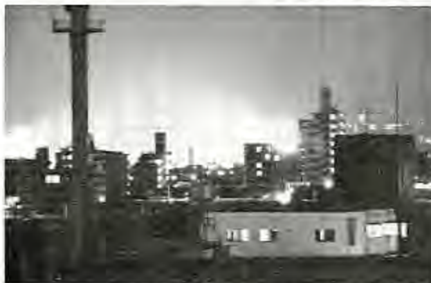
▲田高より等々力競技場をのぞむ

『リーグの灯が田舎から望めます。ヴェルディ川崎の等々力競技場は川向こう、東横線の先。自転車10分の距離です。丸子橋を渡るラモスらに憧れてか、今年はサッカー部員が急増。新入生は17名と、運動部の中で一番多かった。