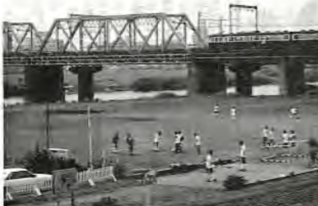
▲サッカー部員急増