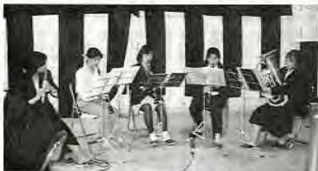
▲地会でのアンサンブル演奏

『リーグの灯が田舎から望めます。ヴェルディ川崎の等々力競技場は川向こう、東横線の先。自転車10分の距離です。丸子橋を渡るラモスらに憧れてか、今年はサッカー部員が急増。新入生は17名と、運動部の中で一番多かった。