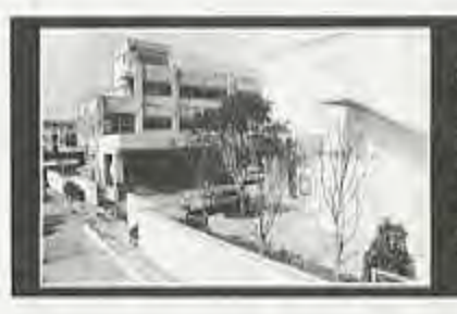
大田ろう学校校歌