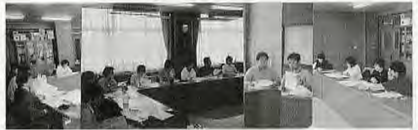
写真は、田高小会議室での幹事会